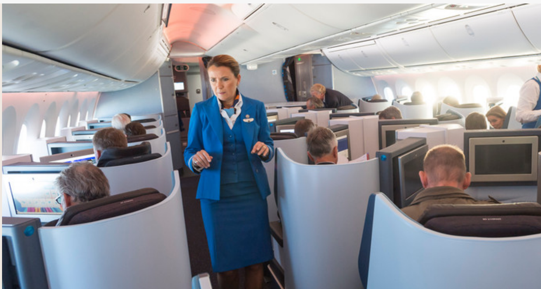
▲ De businessclass in een KLM-vliegtuig.